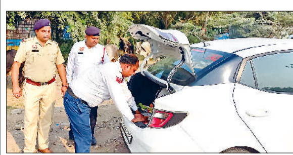
झज्जर। सुरक्षा के मद्देनजर वाहन की जांच करते हुए पुलिसकर्मी।