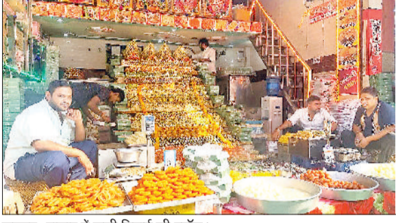
झज्जर। बाजार में सजी मिठाई की स्टॉल।

महंगाई का असर होने के बावजूद लोगों ने त्योहार के मौके पर परंपरागुनार मिठाइयों, गिफ्ट आइटम्स, इलेक्ट्रॉनिक सामान के अलावा सजावट के सामान की खरीदारी दिल से की। बाजार में मिठाइयों, गिफ्ट आइटम्स की भरमार है, लेकिन लोग इस बार मिठाइयों से कहीं ज्यादा खरीदारी