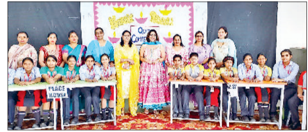
झज्जर। होनहार प्रतिभागी विद्यालय स्टॉफ सदस्यों के साथ।