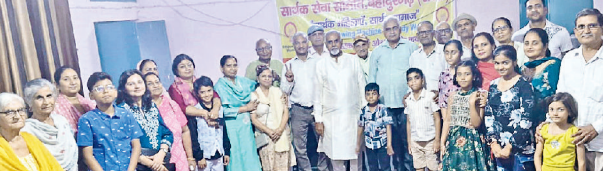
बहादुरगढ़। समारोह में एकत्र सार्थक सेवा समिति के सदस्य।