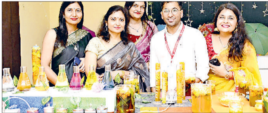
झज्जर। संस्कारम विश्वविद्यालय परिसर में आधुनिक मॉडल के साथ स्टॉफ सदस्य।

संस्कारम विश्वविद्यालय परिसर में इस बार दीपावली के महापर्व को मन को प्रकाशित करो, हृदय को हर्षित करो थीम पर आयोजित किया गया। यह उत्सव केवल दीपों का नहीं, बल्कि विचारों, ज्ञान और संस्कारों के उजास का पर्व बन गया, जहां परंपरा और आधुनिकता का अद्भुत संगम दिखाई दिया। कार्यक्रम का शुभारंभ पारंपरिक दीप प्रज्वलन और सरस्वती वंदना के साथ हुआ। प्रत्येक विभाग ने विषयवस्तु पर आधारित सजावट प्रस्तुत की। प्रौद्योगिकी संकाय ने नवाचार से