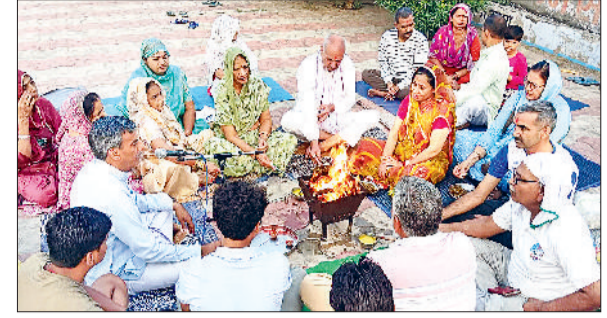
झज्जर। योग शिविर के समापन पर हवन में उपस्थित मुख्यातिथि एवं योगपीठ सदस्य।

■ प्रसाद गिरी योगपीठ द्वारा शहर के टाउन पार्क में कार्यक्रम