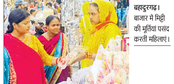
बहादुरगढ़। बाजार में मिट्टी की मूर्तियां पसंद करती महिलाएं।