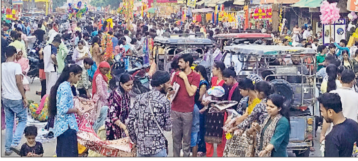
बहादुरगढ़। दीपावली से एक दिन पूर्व बाजार में खरीदारी करते लोग।