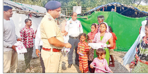
झज्जर। जरूरतमंद लोगों में मिठाई बांटते हुए पुलिसकर्मी।