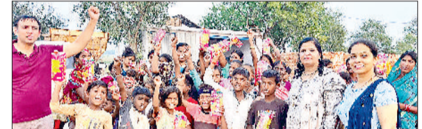
झज्जर। कार्यक्रम में प्रवासी श्रमिकों व बच्चों के साथ संस्था सदस्य।